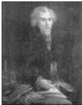
Retrato de Larruga, propiedad de la Real Sociedad Económica Aragonesa de Amigos del País (atribuido a Goya, 1798).

Este zaragozano (nacido en 1747, murió en Madrid en 1803) es por su obra económica el más importante y ambicioso de todo el siglo ilustrado. Tras sus estudios de cánones en las universidades de Zaragoza y Gandía y un breve profesorado en la primera, abandona la carrera eclesiástica y trabaja como bibliotecario. En 1779 le sabemos ya archivero de la Real Junta de Comercio de Madrid, de la que redacta una Historia manuscrita. Curioso recopilador de datos, escribe en 1787 un Manual histórico cronológico y geográfico de todos los países, reinos,