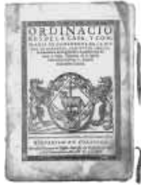
Libro de las Ordenaciones de la Cofradía y Casa de Ganaderos, 1589.

Mientras que en Castilla desarrollaba su poderosa influencia la Mesta, organización que representaba y defendía los intereses de los grandes ganaderos, en Zaragoza lo hacía la Casa de Ganaderos, con similares características y también muy importante papel en su vida económica (otras mestas o ligallos importantes, aunque menores, hubo en Tauste y Ejea, Tarazona y Albarracín, Alcañiz, Teruel, las comunidades de Aldeas de Daroca, Calatayud y Teruel, etc.).